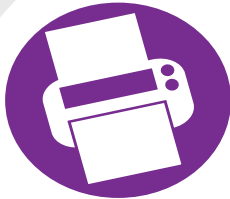
Epson Stylus Photo R3000 inkjet printer